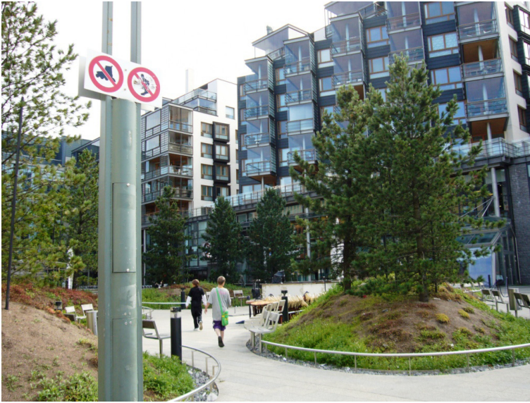
Kuva 4. Tennispalatsin aukiolla pienet kyltit kertovat skeittauksen ja rullaluistelun olevan kiellettyä toimintaa. Figure 4. There are small signs indicating that rollerblading and -skating are prohibited in the Tennispalatsi Square.

Oheinen sitaatti tuo selvästi esiin sen, kuinka eri ihmiset ovat eri asemassa julkisen tilan käyttöön liittyvien toiveidensa ja niiden oikeutuksen suhteen. Kaupallisuus ja kuluttaminen vaikuttavat siihen, kuinka tilan käytön tapoja arvotetaan. Tennispalatsin aukion ravintolat ovat kauppakeskuksen vuokralaisia, joten kauppakeskuksen näkökulmasta maksavien ravintola-asiakkaiden halu olla ”rentoutuneessa tilassa” oli tärkeämpää kuin skeittaajien halu käyttää tilaa harrastukseensa. Haastattelemini nuorten joukossa oli myös skeittaajia ja heidän kavereitaan. Pyysin heitä kertomaan näkemyksiään siitä, miksi tietyillä alueilla skeittaaminen oli kielletty: