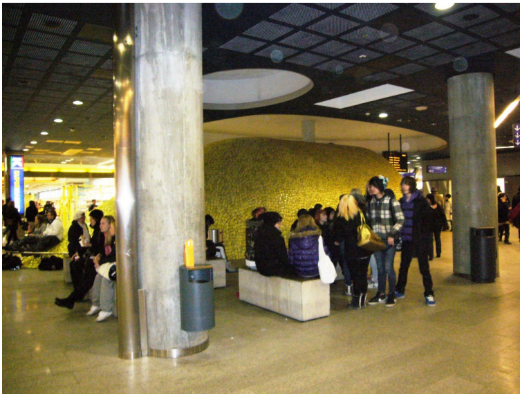
Kuva 6. Kauppakeskuksen katutason betonipenkit olivat nuorten suosima hengailupaikka keväällä 2010.

Monet nuoret kertoivat, kuinka osa penkeistä oli viety kevään 2010 kuluessa pois. Syyksi he arvelivat hengailun aiheuttamat häiriöt: