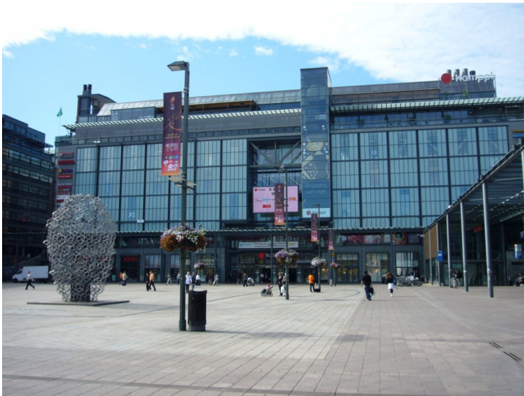
Kuva 1. Kampin kauppakeskus sijaitsee Helsingin ydinkeskustassa. Pääsisäänkäynnin edessä sijaitsee Narinkkatori, joka on kaupungille kuuluvaa julkista tilaa.

E-tasohan [katutaso] on yleistä jalankulkualuetta eli siinä toimivat yhteistyössä kauppakeskus ja Helsingin kaupunki ja Espoon kaupunki, eli se on