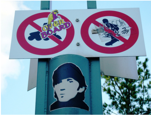
Kuva 5. Kesän 2011 kuluessa skeittaus- ja rullalautailukieltojen päälle ilmestyi tarroja. Sekä Overboard että Volcom myyvät mm. skeittaajille suunnattua nuorisomuotia. Figure 5. During the summer 2011 some stickers appeared on the prohibition signs. 'Overboard' and 'Volcom' are brands selling fashion targeted for example to skateboarders.

le asiasta ja pyytämällä heitä olemaan tupakoimatta. Kun kiellon noudattamatta jättämisestä ei voida rangaista, ei kehotuksilla tai kieltomerkeillä ole sanottavaa vaikutusta. Nuorten kertoman mukaan heidän tupakointiinsa kuitenkin puututtiin: