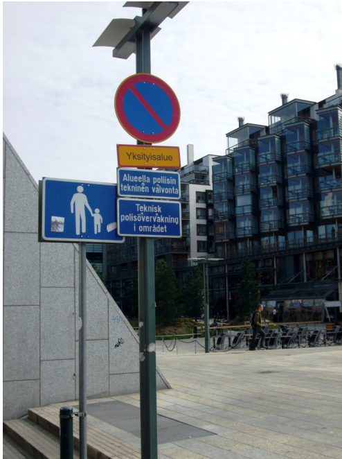
Kuva 3. Tennispalatsin aukio on merkitty kyltein yksityisalueeksi. Fredrikinkadun puoleisessa kyltissä kerrotaan lisäksi alueella olevasta poliisin teknisestä valvonnasta.

Figure 3. Tennispalatsi Square is marked to be private space. The sign facing Fredrikinkatu street tells people about the technical surveillance carried out by the police.